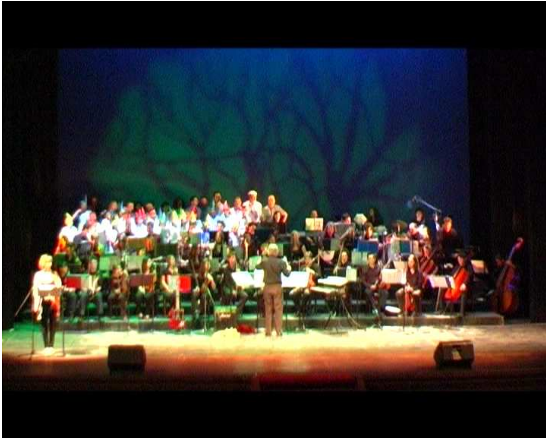
Orchestra e Coro