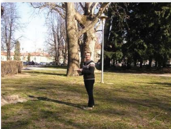
Obiettivo 4. - Operatrice del Nucleo di Didattica Ambientale - Sezione naturalistica durante una visita guidata al Parco dell'Allea