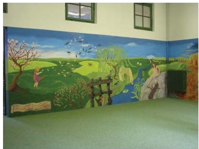
Obiettivo 4. - "Progetto Murales" - Aula Laboratorio Territoriale della Rete Regionale di Servizi per l'Educazione Ambientale