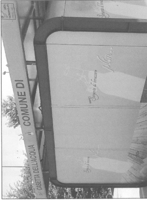
VISTA POSTERIORE "TIPO"